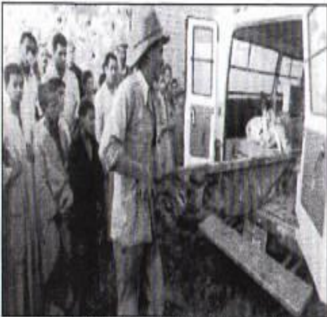
عمال لنقل مصريون يرفعون جثث الضحايا في بلدة دمرتها العاصفة بالبحر في صعيد مصر

حول قنطرة بركان باروجاري الذي ضرب الجزيرة في يونيو الماضي، وتسبب انهيار هذه الصخور في تعمير عدد كبير من المنازل في فريتي ليكل أوتوا وكيمبانج كيراج وفي الهند تكون وكالة الأنباء الطورية ان عدد ضحايا الأمطار الموسمية والقوسبات التي تعرضت لها الهند وصل الى 122 قتيلاً، وقالت وكالة الأنباء الهندية ان 118 قرية هتية على الأقل قد تصورت من جراء الفيضانات. وفي مصر طرقت آثار الكارثة تتكشف لحظة بعد أخرى، حيث ثبت وجود انهيارات كبيرة في معظم العمارات.