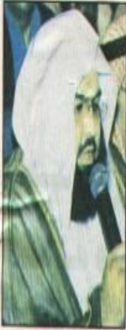
• - عبدالرحمن السديس

وتجروا على النصوص الشرعية ففسروها وحملوها ما لا تحتمل وأن ذلك استخفاف بالدين وجرأة على السنة بل أنه وصل الأمر ببعض المفتونين أن ينزل القضايا الغيبية كزوال السمع عليه السلام وتحديد قيام الساعة وربطها بهذه الأحداث الزمانية.